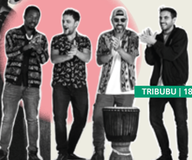
TRIBUBU | 18.08.