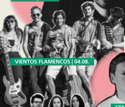
VIENTOS FLAMENCOS | 04.08.