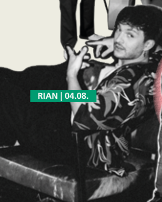
RIAN | 04.08.