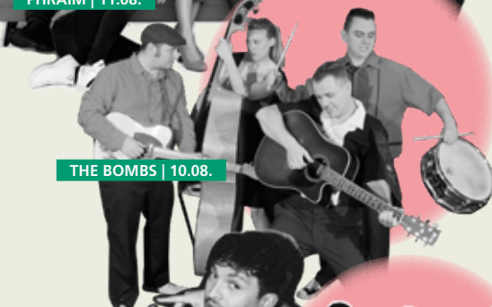
THE BOMBS | 10.08.