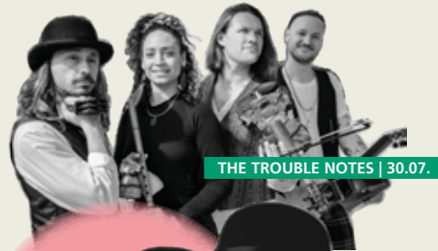
THE TROUBLE NOTES | 30.07.